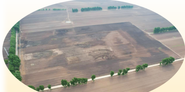
公主岭市大榆树镇田块整治后。