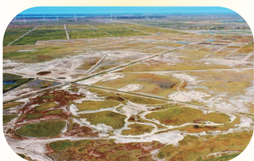
新平安镇全域土地综合整治试点项目整治前后对比图。