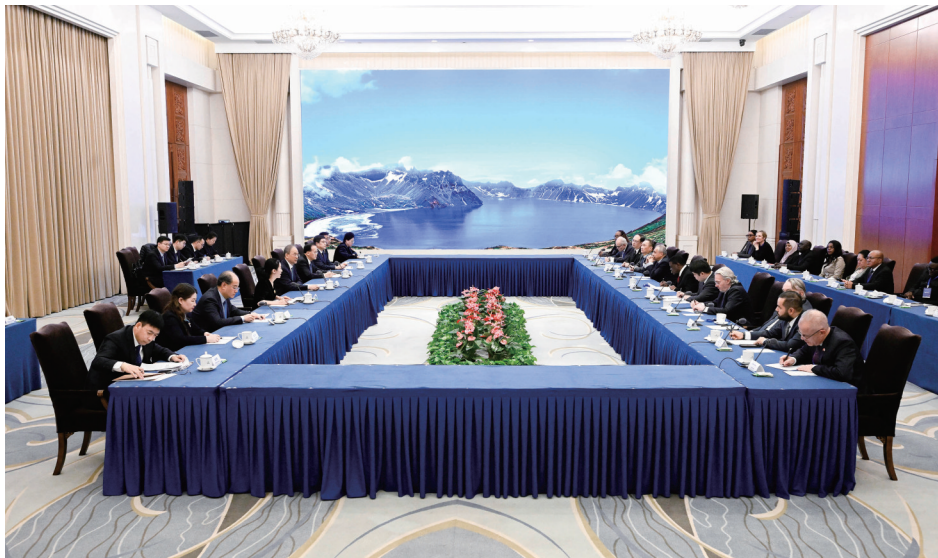
12月16日,省委书记黄强在长春会见驻华使节代表团一行。

副省长刘凯,也门驻华大使穆罕默德·梅塔米、哥伦比亚驻华大使塞尔希奥·卡夫雷拉、斐济驻华大使李振凡、北马其顿驻华大使萨什科·纳塞夫、泰国驻华大使韩灿才、黎巴嫩驻华大使米拉德·拉德,外交部有关同志,马达加斯加、萨摩亚、赞比亚、苏里南、冈比亚、毛里求斯、马尔代夫、缅甸、新西兰、克罗地亚、塞内加尔驻华使节,有关国际机构代表等参加会见。