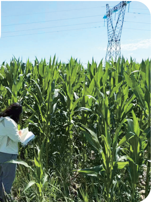
东北再担保吉林分公司的“吉农种易担”产品让托管种植主体顺利流转土地。

吉林分公司联合吉林省农投土地资源开发有限公司、吉林省大方农地管理有限公司，创新推出“吉农种易担”集约化土地种植贷款担保产品，构建起“土地整合+融资担保+全链服务+产销对接”的闭环模式。大方农地管理有限公司整合零散土地并委托托管种植，东北再担保吉林分公司为土地流转和托管种植主体提供融资担保。永信农民专业合作社成为直接受益者，获得不超过500万元贷款担保，顺利流转2000亩土地，备齐了农资。截至目前，“吉农种易担”已累计扶持10户企业，累计放款7000余万元。