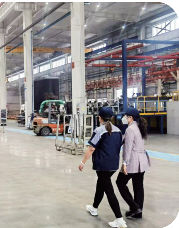
东北再担保公司“科创优贷”业务，为科技企业企业发展带来“及时雨”。

在大连，作为东北亚重要的海产品养殖加工及冷链贸易枢纽，海洋经济是当地的优势产业，但辖区内众多海产小微企业因“轻资产、无抵押”陷入融资困境。“我们的资产都在冷库的冻鱼冻虾上，没有不动产抵押，银行传统信贷产品根本不适用，外埠资金成本又太高，想扩大经营难如登天。”一家海产小微企业负责人的无奈，道出了行业的普遍困境。