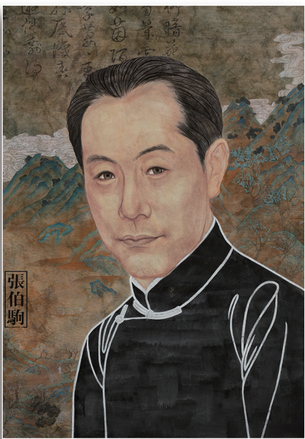
张伯驹先生像（中国画）