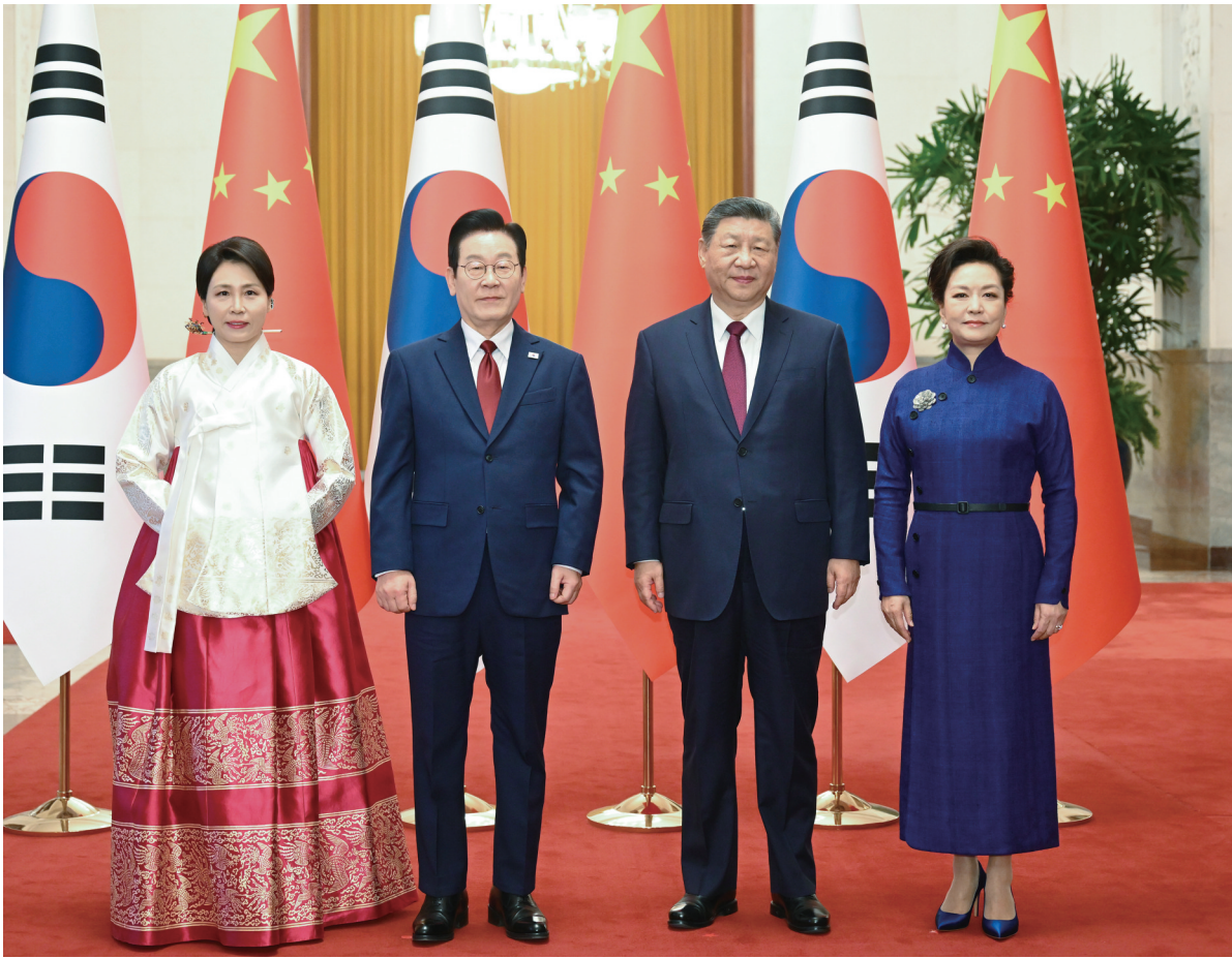
一月五日下午，国家主席习近平在北京人民大会堂同来华进行正式访问的韩国总统李在明举行会谈。这是会谈前，习近平和夫人彭丽媛同李在明和夫人金惠景合影。

新华社北京1月5日电(记者冯歆然 曹嘉玥)1月5日下午，国家主席习近平在北京人民大会堂同来华进行国事访问的韩国总统李在明举行会谈。 习近平向韩国人民致以诚挚新年