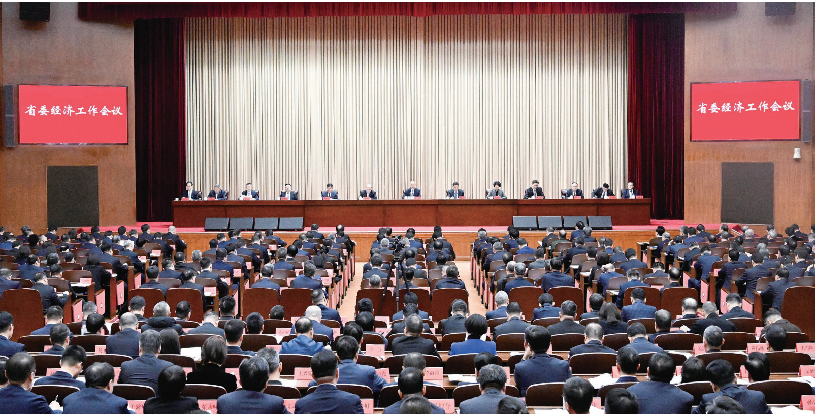
1月5日，省委经济工作会议在长春召开。

恩奋进，坚持把发展立足点放在高质量发展上，着力建设现代化产业体系，进一步全面深化改革，全面推进乡村振兴，开创民族团结进步新局面，统筹发展和安全，以高质量党建引领高质量发展，实现“十四五”圆满收官，为“十五五”经