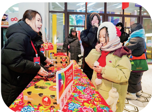
游客品尝智利车厘子。

长春冰雪新天地内巨型车厘子冰雕引人注目,匠人以精湛技艺还原了智利车厘子饱满圆润的形态。白天,在阳光下折射出晶莹光泽;夜晚,红色冰灯还原鲜果色泽,成为游客打卡拍照的热门选择。