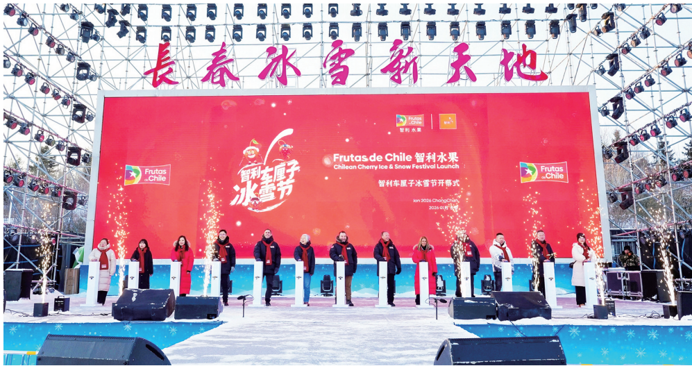
智利车厘子冰雪节在长春冰雪新天地开幕。

看来,中国已成为智利新鲜水果的最大市场。他说:“中国消费者非常懂水果、重视品质,我们会全力以赴为中国消费者提供优质产品、良好消费体验,努力覆盖更多销售渠道和城市。目前,我们正在拓展二、三线城市的销售网络,希望通过本次活动让更多人了解、品尝智利车厘子。”