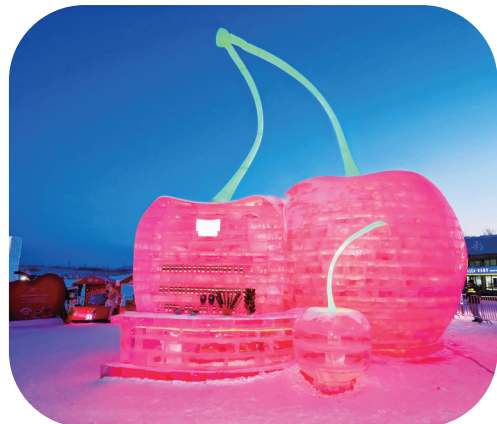
夜晚,“巨型车厘子”冰雕亮起,还原鲜果色泽。

夜幕降临,巨型车厘子公仔与游客在冰天雪地中蹦迪狂欢,将活动气氛推向高潮。智利车厘子冰雪节不仅仅是一场品牌嘉年华,更是智利车厘子深入中国二三线城市消费市场、贴近消费者的重要举措。本次冰雪节继长春站启动后,将通过零售、生活方式及节庆消费等多元场景在全国范围内展开,借助冬季冰雪热进一步释放市场消费潜力,让智利车厘子从进口水果成为“冬日文化符号”。