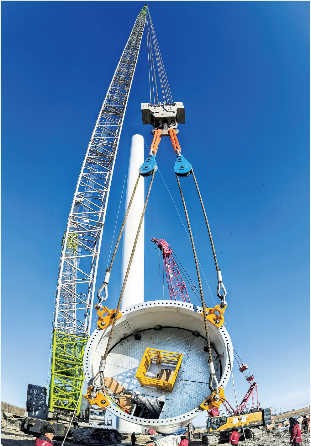
新能源装机规模达到1910万千瓦，成为东北首个“千万千瓦级新能源发电城市”。

值年均增长8.9%，结构明显优化；固定资产投资年均增长14.6%，投资额实现翻一番，向着基本实现社会主义现代化迈出了坚实一步。 2025年2月8日，习近平总书记时隔五年再次踏上吉林大地，为吉林发展把脉定向、指路领航。一年来，白城市牢记嘱托、感恩奋进，全市经济社会发展稳中向好、进中提质。预计地区生产总值增长5%左右，规上工业总产值、增加值分别增长12.5%、3.5%，固定资产投资增长7%，社会消费品零售总额增长3%，地方级财政收入按可比口径增长12.1%。 “十五五”时期，是白城发展向上攀登、向新转型的关键