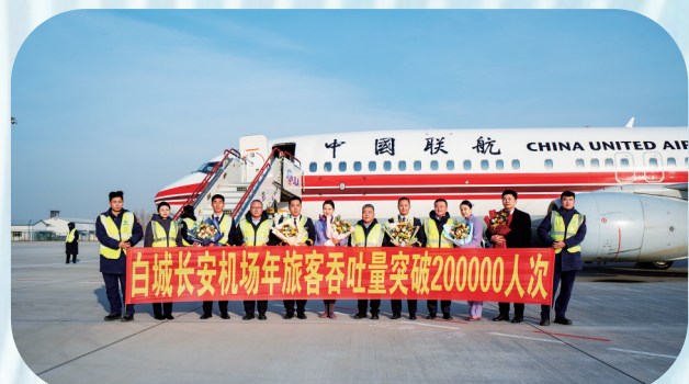
2025年12月，白城机场年货客吞吐量首次突破20万人次。