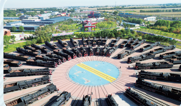
2025年，大安机车博览园获评“吉林省十大出园景区”。