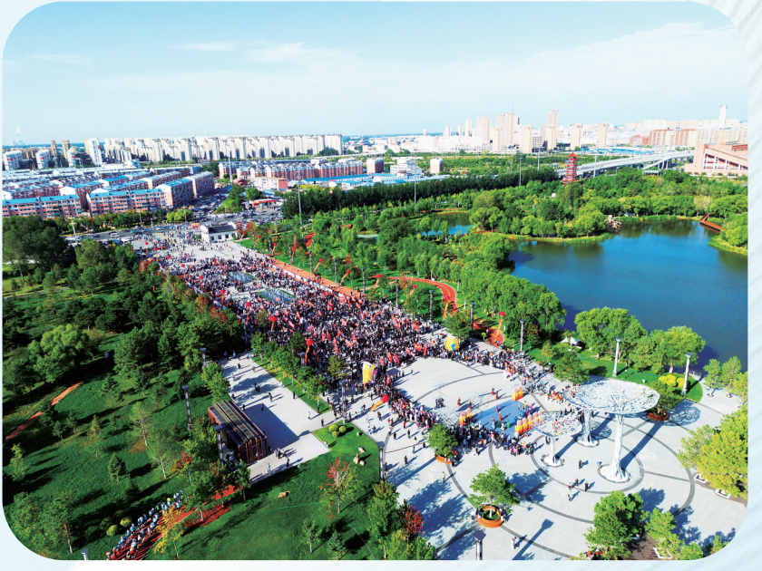
白城市践行“公园城市”理念，“疏朗通透、干净整洁、文明有序”的城市特色彰显。