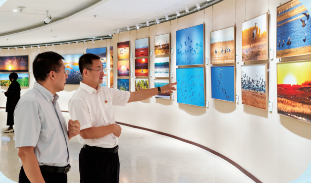
向海、莫莫格主题摄影美术展在北京、杭州、长沙等地巡展，生动展现白城市湿地生态保护成果，立体呈现向海、莫莫格自然保护区“湿地地IP”生态旅游改革试点成效。