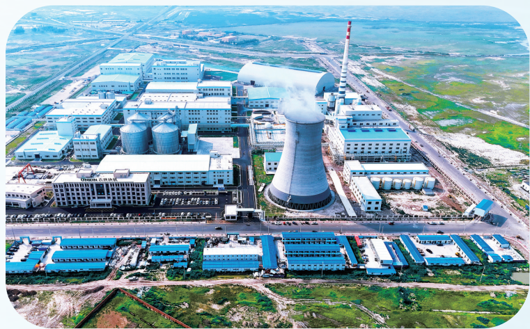
吉林协联生物科技有限公司2025年全年满负荷生产，展现出强劲的发展势头。