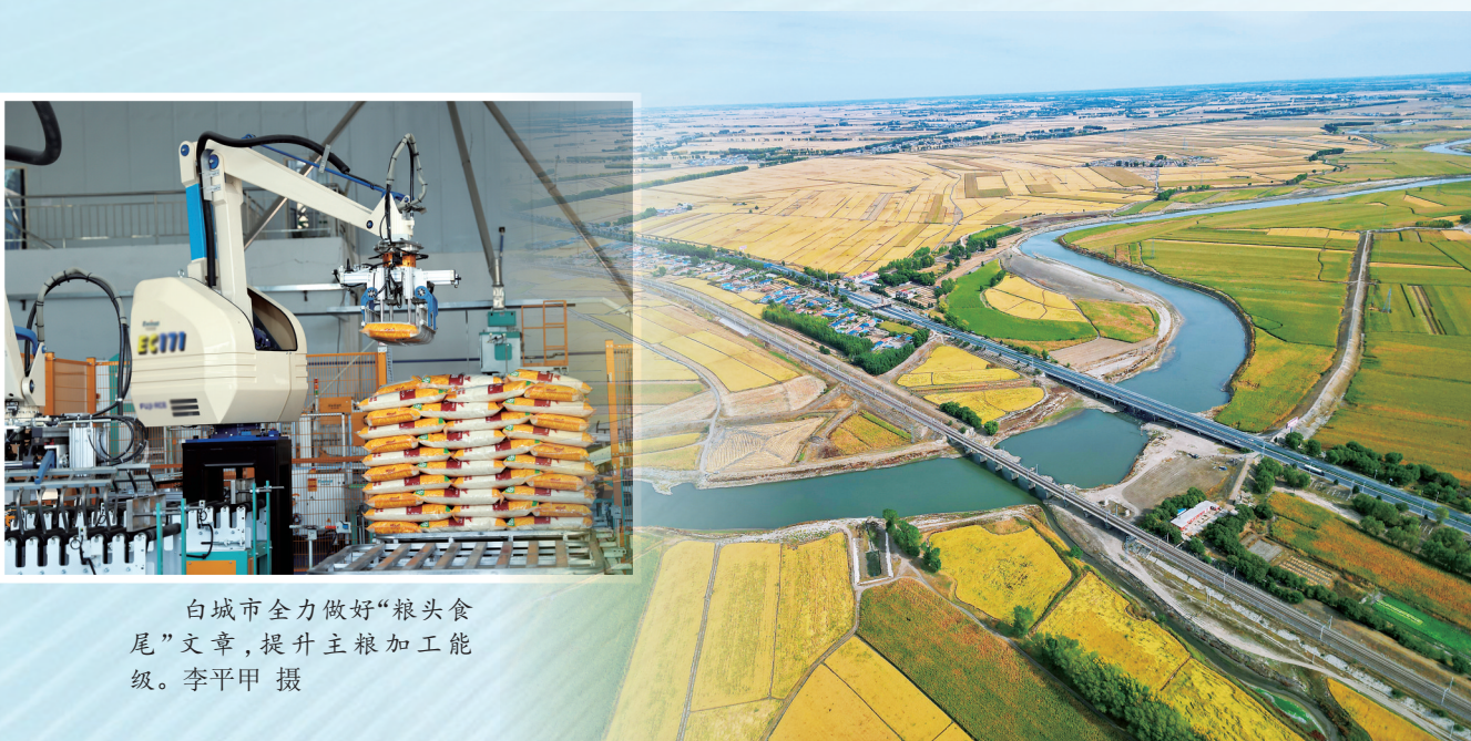
2025年，白城市粮食总产量达到121亿斤，创历史新高。

五年来，全市坚持创新发展，培育新质生产力实现新突破。新能源装机规模达到1910万千瓦，成为东北首个“千万千瓦级新能源发电城市”。世界瞩目、全国领先的洮南绿色甲醇、大安绿氢合成氨项目正式投产，白城被纳入第一批国家级能源领域氢能试点区域。实施盐碱地等耕地后备资源综合利用国家试点，创新盐碱地治理“三种模式”。玉米、肉乳制品2个产业纳入全省先进制造业产业集群。嫩江湾创成国家5A级景区。五年来，全市坚持协调发展，推动城乡融合发展得到新提升。城镇化率较“十三五”末提高3.4个百分点。城乡居民收入倍差从2.19缩小至1.94。践行“公园城市”理念，“疏朗通透、干净整洁、文明有序”的城市特色彰显。保护传承