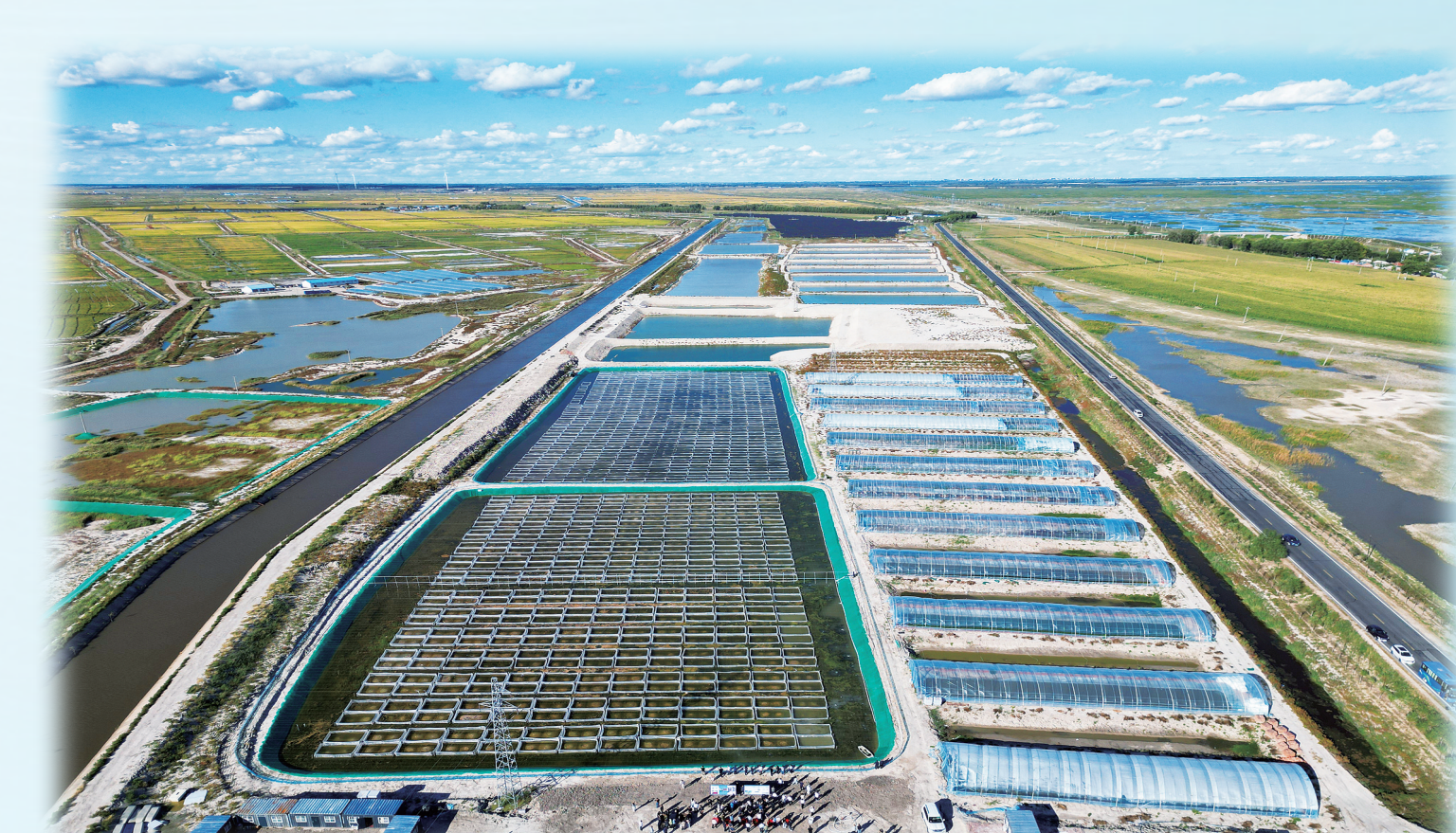
国家盐碱地试点项目、高标准农田建设稳步推进。

全市必须全面贯彻习近平新时代中国特色社会主义思想、习近平总书记关于东北全面振兴和吉林工作系列重要指示精神，坚决扛稳维护国家“五大安全”重要使命，更加注重统筹市县一体发展，更加注重壮大实体经济根基，更加注重资源优势互补释放，更加注重居民收入和财政收入双提升，深入实施“一三三四”高质量发展战略，加快建设“一城三区”，着力打造省域新的经济增长极，确保基本实现社会主义现代化取得决定性进展。 全市必须牢牢把握重大原则和目标导向，坚持党的全面领导，坚持人民至上，坚持高质量发展，坚持全面深化改革开放，推动白城高质量发展踔厉奋发，应用型科技创新深度拓展，全面深化改革开放实现新突破，社会文明程度明显提升，人民生活品质不断提高，美丽白城建设取得新的重大进展，安全治理效能全面增强，努力实现经济增速高于全国、全省平均水平。 全市必须强化系统观念，统筹抓好九个方面重点任务：一是因地制宜发展新质生产力，构建具有白城特色优势的现代化产业体系；二是