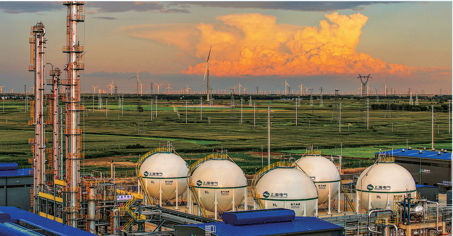
2025年7月，上海电气洮南绿色甲醇项目投产，产出全国首批规模化绿色甲醇，并作为船用燃料走向国际市场，标志着“吉氢入海”取得实质性进展。邸会宁 摄