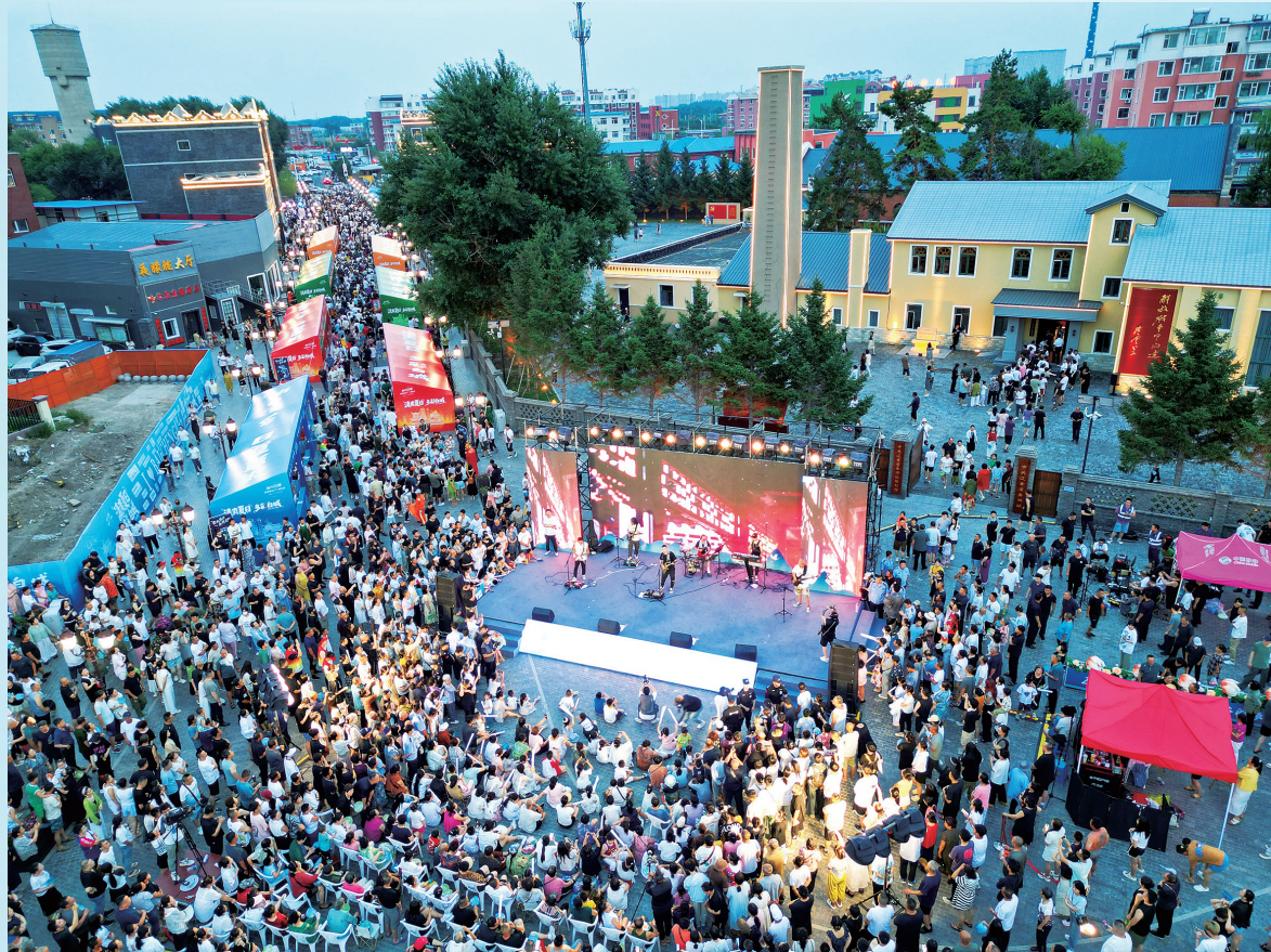
改造提升辽吉历史文化街区，群众文化活动蓬勃开展。