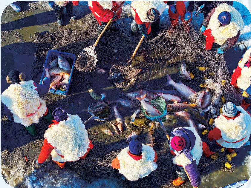
茭白、小龙虾等实现“南物北养”，渔业综合产值完成倍增。