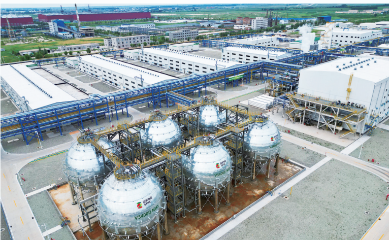
2025年7月，作为吉林省“氢动吉林”行动的启动项目，国电投大安风光制绿氢合成氨项目正式投产，标志着中国在绿色氢基能源领域实现历史性跨越。