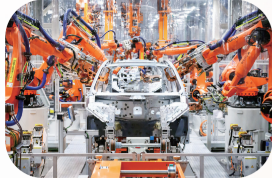
奥迪一汽新能源汽车有限公司焊装车间。