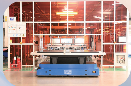
一汽弗迪新能源科技有限公司生产车间。