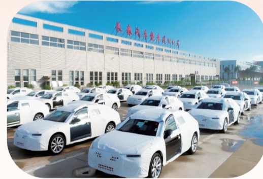
长春汽车整车进口口岸。

新兴产业从“多点萌芽”到“集群发展”，开辟了产业振兴的新赛道。生物医药产业快速成长，2025年，全市实施5000万元以上医药健康产业项目53项，总投资195亿元。2025长春健博会成功举办，7项医药健康领域新技术、新成果发布，32个项目完成签约。修正药业智能生产基地投产达效；长春高新旗下子公司金赛药业的全资子公司上海赛增医疗科技有限公司，与美国Yarrow Bioscience, Inc. 正式签订独家许可协议，以13.65亿美元付款总额，创下我省创新药对外授权的纪录；长春永春现代国际生物医药城加快建设，核心