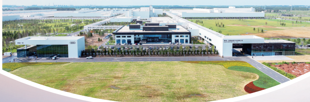
奥迪一汽新能源汽车有限公司。

展望“十五五”，长春将持续以“3转4强7新”体系为支撑，聚焦新质生产力培育，深化产业结构调整，巩固汽车制造、装备制造等传统优势，壮大生物医药和生命健康、光电信息等战略性新兴产业，让传统产业更具竞争力、新兴产业更具引领力、未来产业更具爆发力。这座充满活力的北国春城，必将在东北全面振兴的时代浪潮中乘风破浪、行稳致远，书写出更加辉煌的振兴篇章。