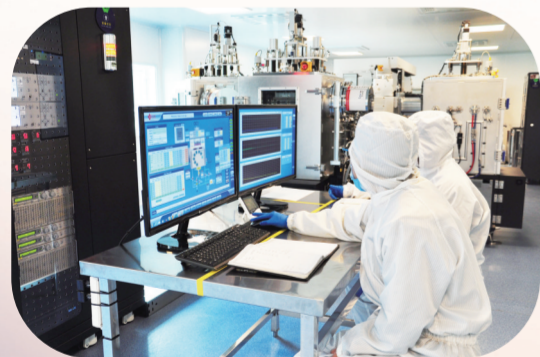
长春光电信息产业快速发展，吉林奥美德光电材料股份有限公司已建成国内最大规模显示材料生产基地。