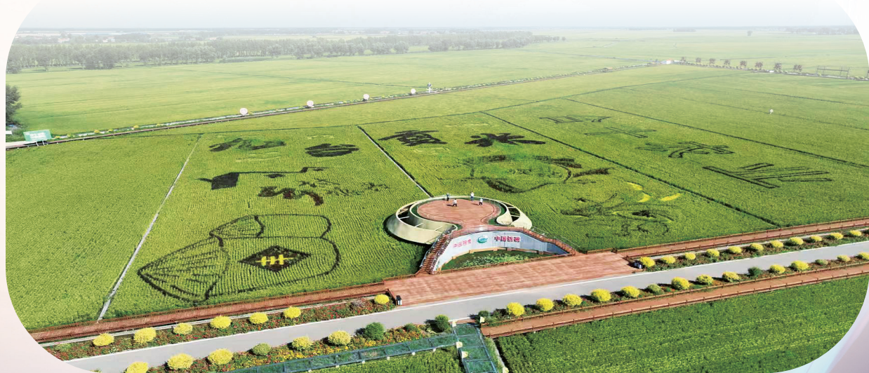
长春持续加强农业科技与品牌建设。

站在新起点，长春将持续深耕现代化大农业，推进智慧农业全链条数字化升级，在黑土上续写丰产增收新篇，推动乡村振兴成色更足，为农业强省建设与国家粮食安全注入更强劲的长春力量。