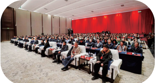
2025年“百所高校、千名博士”长春产业行(医药健康专场)活动。