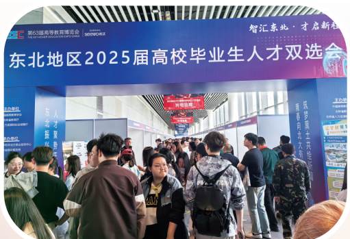
2025年高等教育博览会引才专区。