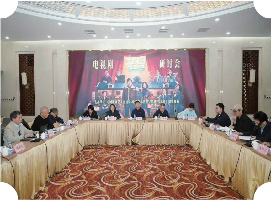
电视剧《老舅》研讨会在北京举办。