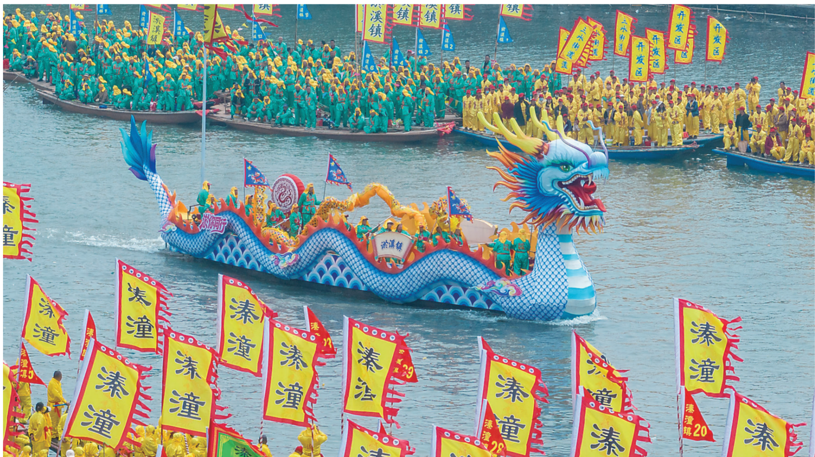
4月6日，参加会船表演的选手在龙舟上舞龙（无人机照片）。4月6日，2026年泰州姜堰溱潼会船节在江苏省泰州市姜堰区溱湖国家湿地公园开幕，数百条各式船只和上万名会船选手飞篙走桨，奋勇争先，演绎历久弥新的民俗画卷。“天下会船数溱潼，溱潼会船甲天下。”溱潼会船又名清明会，由南宋相沿至今，被列入国家级非物质文化遗产名录。