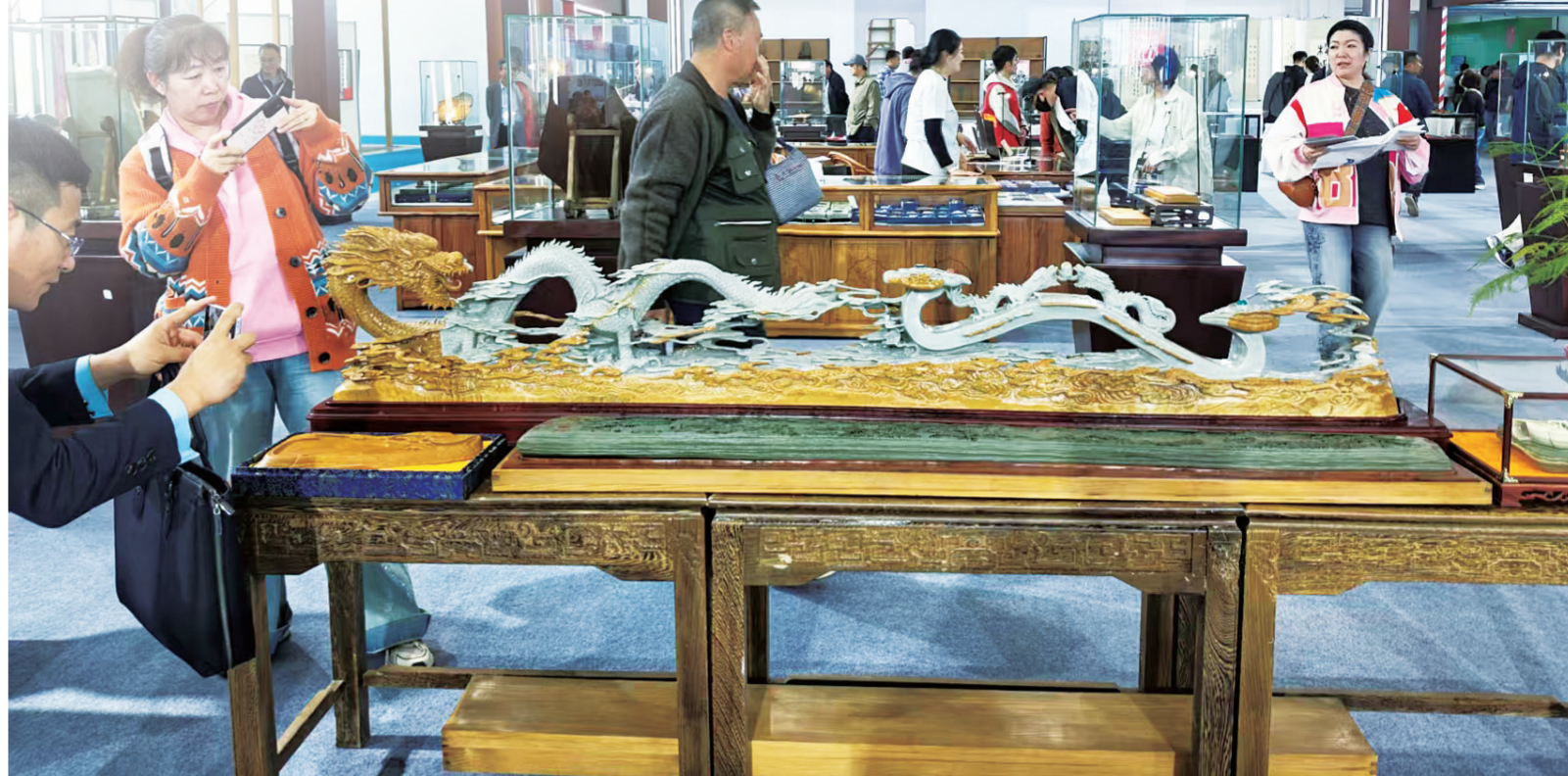
精美的松花石产品吸引游客驻足观赏。

加强顶层设计与规划引领。加快建设松花石创意产业园，紧密对接长白山“新三宝”整体规划布局，明确发展定位与产业实施路径，积极争取项目、资金和政策支持，为园区未来建设奠定基础。