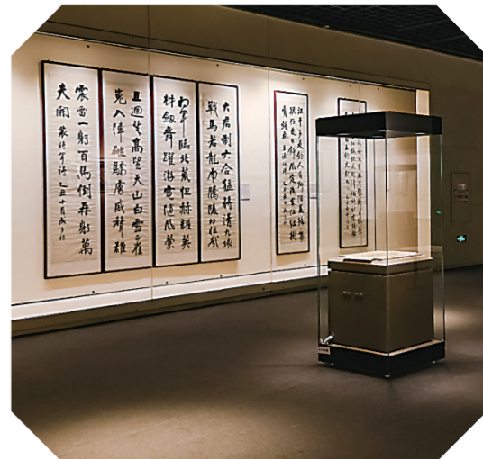
“雪满江山一塞翁——吉林三杰翘楚成多禄遗墨展”在吉林省博物院开展。

本报讯(记者裴雨虹)日前，“雪满江山一塞翁——吉林三杰翘楚成多禄遗墨展”在吉林省博物院四层D区开展。这场由吉林省博物院与吉林市博物馆联手打造的文化盛宴，汇集珍贵书法遗墨，让百年关东文脉跨越时空，与市民游客相见，掀起一场传统文化鉴赏热潮。