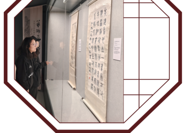
图为吉林艺术学院的学生们在参观“艺脉薪传——吉林艺术学院藏书画精品展”。