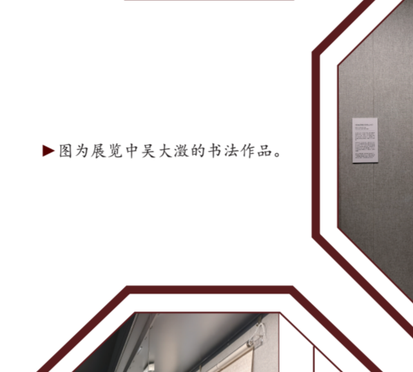
图为展览中吴大澂的书法作品。