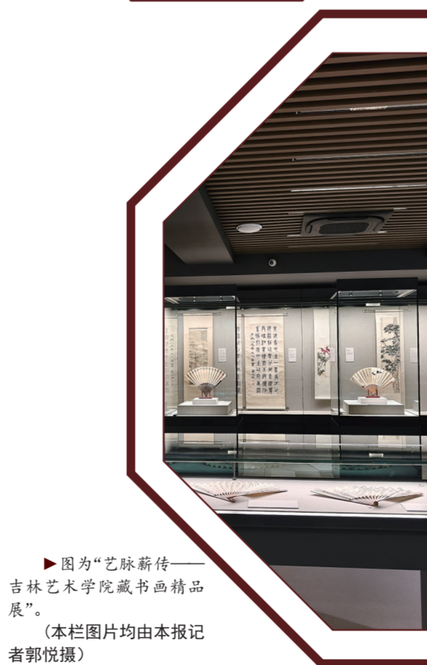
图为“艺脉薪传——吉林艺术学院藏书画精品展”。