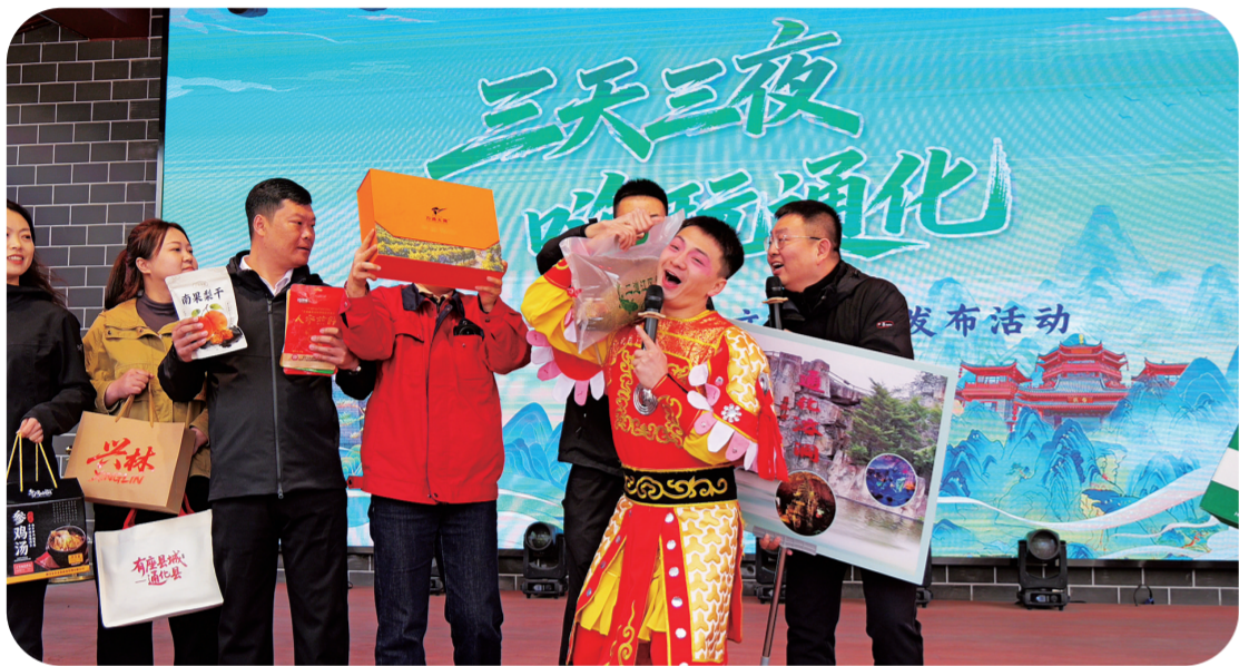
“雪饼猴”助力，推介通化好物。

活动现场特设文旅好物“投喂”互动环节，通化人参、集安人参精深加工产品、通化葡萄酒、松花砚、白小桃罐头、高句丽文创等特色好物集中亮相。“雪饼猴”与推介官趣味互动，展示通化人参文化、百年酒窖底蕴、传统非遗魅力与地域美食风味等，全方位展现通化“文旅+特产”融合成果。