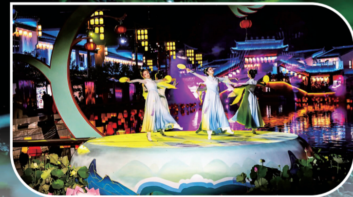
柳河参乡水街将于5月1日全新开放。