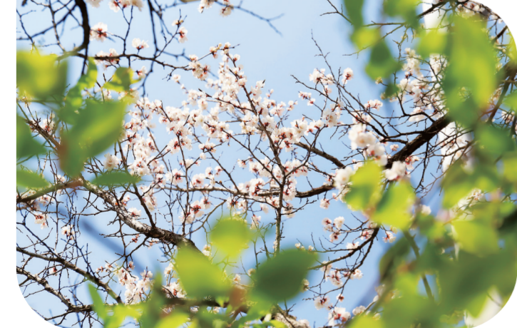
在通化，共赴一场春与花的邀约。