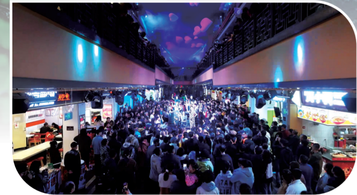
夜游通化老城·龙兴里，沉浸式体验民国风情。