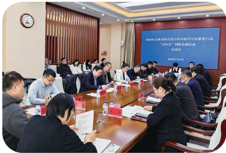
2026年“吉时语”网络直播活动启动会。

时值春分，仲春伊始。黑土地上的冻土刚刚化透，农民们正盘算着今年种点啥。“快看！院士来直播了！”这条消息像长了翅膀一样，在各大种植微信群里飞速传开。 作为省科技助力乡村振兴专家服务团的总团长，中国工程院院士李玉亲自走进“吉时语”直播间，带来一场“践行大食物观——小蘑菇大财富，吉林‘菌’力全开”的“开春第一课”。总团长打头阵，首场直播的分量，不言而喻。 “市场波动大，品种咋选？”“东北气候适合种啥菇？”李玉院士结合过去两年产业发展特点和最新的技术迭代，逐条分析。他告诉农户：眼下食用菌产业正面临新一轮布局调整，要紧盯市场需求，发挥东北冷凉资源优势，别盲目跟风。一旁的吉林农业大学菌物学院李晓教授，从菌种选择到温湿度控制，详细讲解羊肚菌、黑木耳的种植细节。 “听院士一讲，心里亮堂了！”屏幕上，评论区热闹了起来。一位蛟河市的菌农更是报出喜讯：“去年跟着院士试种了两棚木耳，多赚了8000元！今年一看到直播预告，把左右邻舍全喊来了。”这场直播，多平台累计观看上万人次。不少农民边看边记，笔记本上密密麻麻画满了箭头和问号，然后再把问题打在直播间的公屏上，等着院士答疑。 一场直播下来，菌农们心里有了底，头脑里也有了招。李玉院士从产业大势讲到棚间管理，把“小蘑菇”背后的“大道理”说得