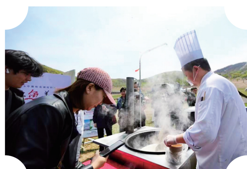
2026中旅松花湖开江鱼美食节暨第七届山地风筝文化节启幕。

大东山水迎客至，渔韵春光赴约来。中旅松花湖度假区以春日为序、以文旅为媒，持续深挖山水资源、创新文旅业态，诚邀八方游客走进青山绿水间，品鱼鲜、赏花海、享惬意，解锁四季山水度假的独特魅力。