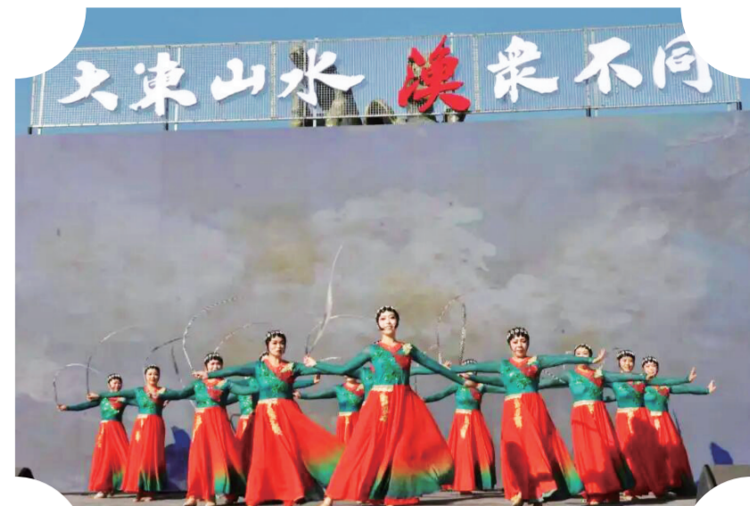
“松江百姓大舞台”聚力长春都市圈文艺汇演，在松花湖畔的东大广场精彩亮相。

此外，5月3日，吉林市群众艺术馆演职人员还奔赴长春接力演出，以“你来我往”的文化互访，为长春现代化都市圈文化建设注入源源不断的活力。