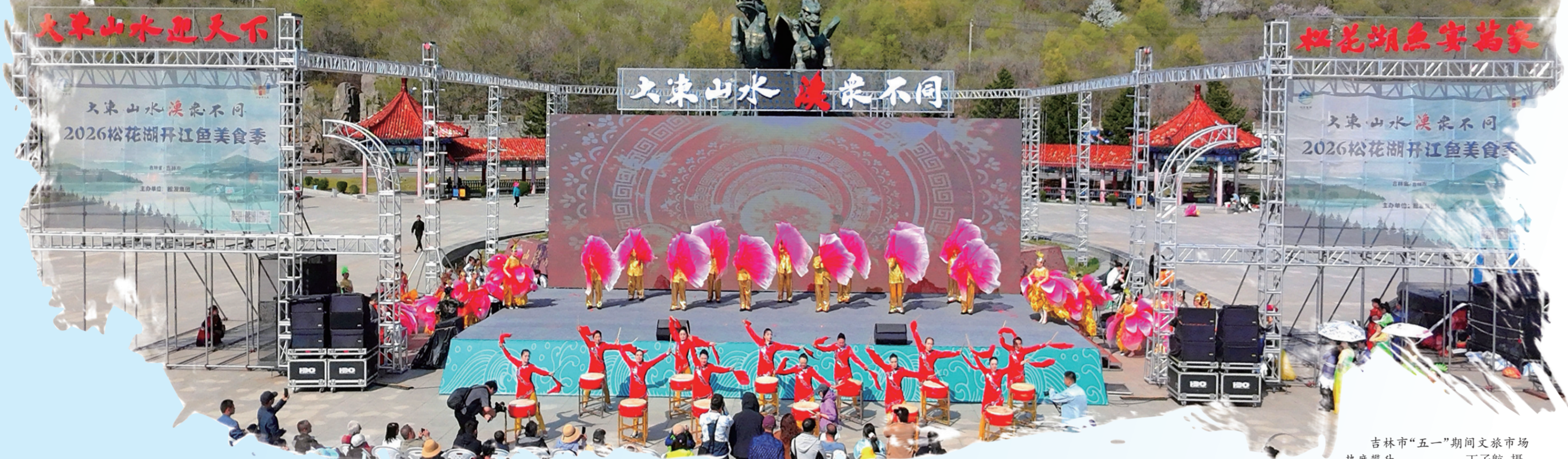
吉林市“五一”期间文旅市场热度攀升。

江风拂面，湖鲜飘香。2026年“五一”假期，吉林市以“大东山水·春满江城”为主题，推出文旅旅体活动106项，打造全时段文旅供给体系。这个假期呈现“春景靓、文博热、人气高、秩序好”的蓬勃态势；特别是文旅热力升腾，带动消费活力奔涌，大东山水间尽显经济向好气象。