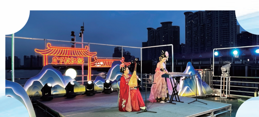
“江韵非遗·劳动礼赞”系列演出活动迎来古风民乐专场，在吉林市三道码头泰湾游船船上如约上演。

夜色渐浓，江声依旧，国风的余韵在晚风中久久不散，为这个劳动节的夜晚写下了一个诗意的注脚。