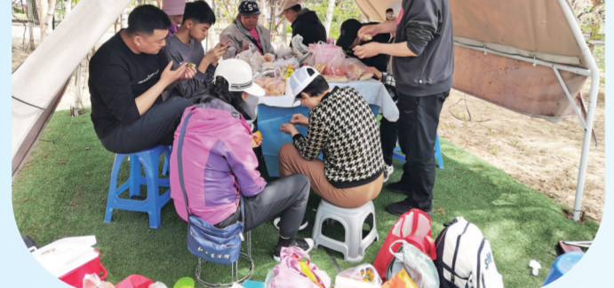
“五一”期间，吉林市各景区游客如织。

道路交通畅通有序，客流云集共赴春日之约。“五一”期间，吉林市高速公路区车流量44.15万台次，增长4.14%。72条公交线路、34个国有停车场免费，开通美食直通车，推出联票优惠等“吉心服务”。文化市场执法人员全程值守，保障平稳有序。