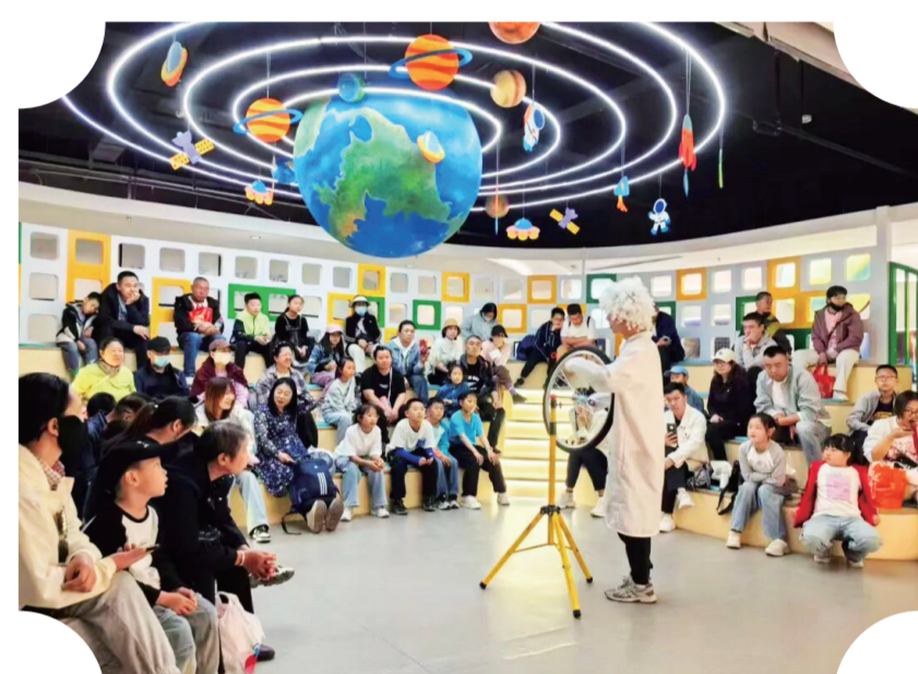
吉林市东大旺山公园人气旺！