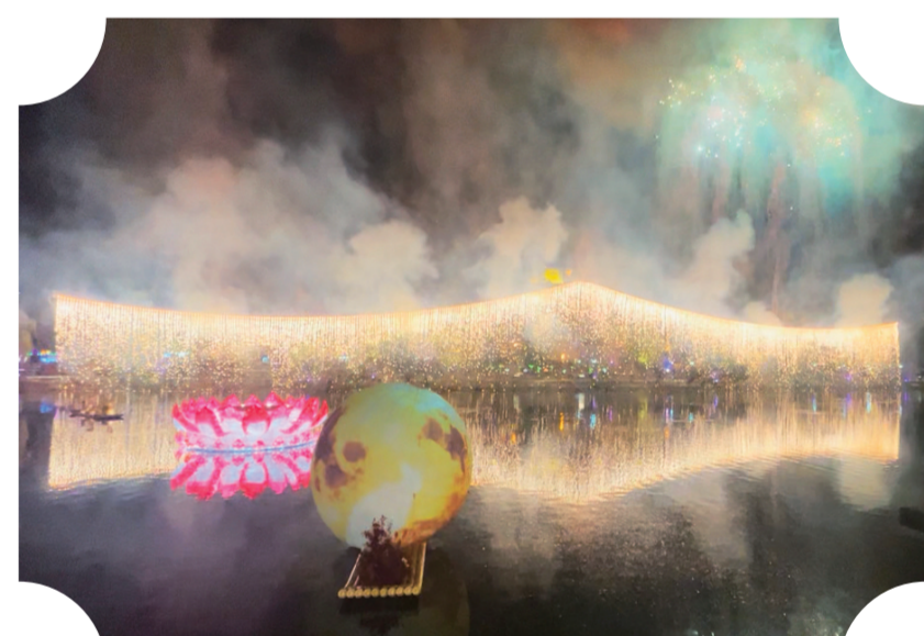
吉林市北山公园荷塘月色，烟花瀑布流光溢彩。

这场融合了国风雅韵、民间绝技与烟花盛典的视听盛宴，在铁花飞舞的壮丽景象中圆满落幕。为市民和游客在五一假期留下了一段难以忘怀的夏夜记忆。