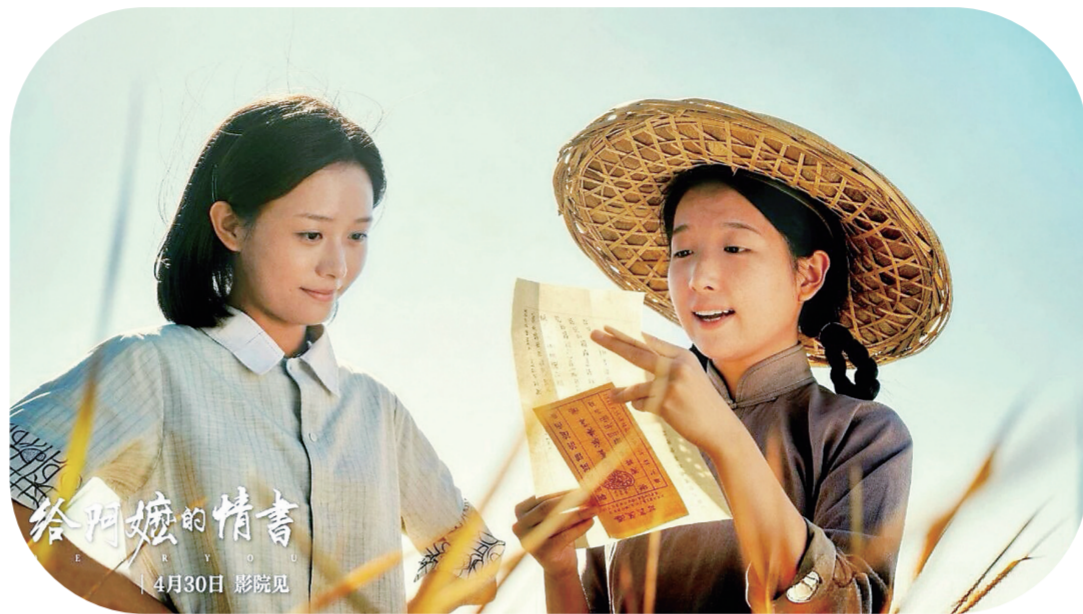
电影《给阿嬷的情书》剧照

对于吉林影视而言，这部影片是启示，更是激励。立足深厚光影底蕴，坚守内容创作初心，从本土文化中汲取养分，从人类共通的情感中寻找共鸣，吉林电影人定能创作出更多像《给阿嬷的情书》一样，有温度、有质感、有力量的优秀作品，让“新中国电影摇篮”的荣光，在新时代持续绽放光彩。