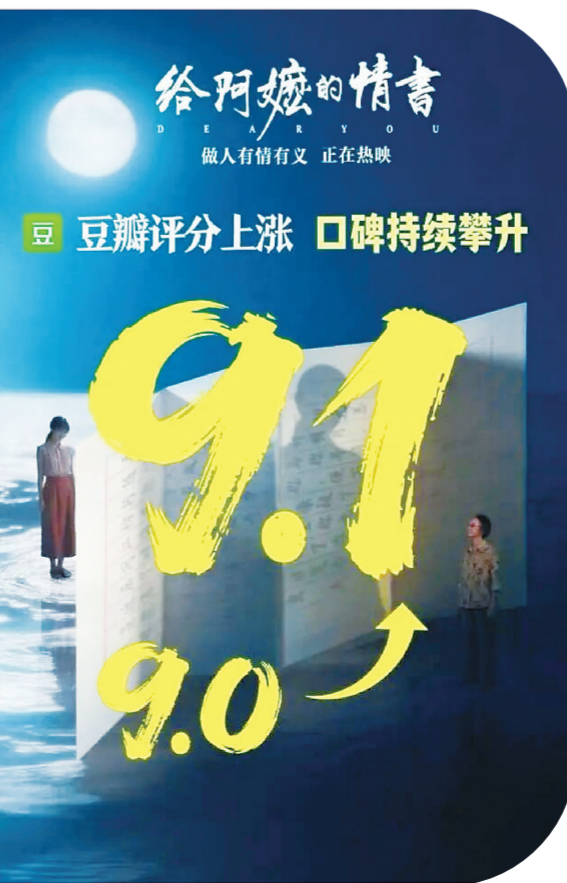
电影《给阿嬷的情书》票房破亿海报和豆瓣评分海报