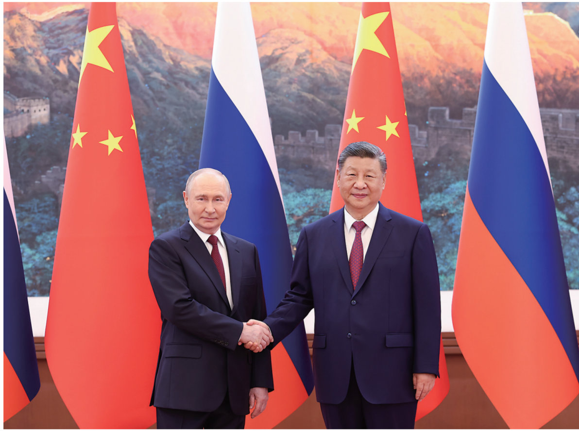
5月20日上午,国家主席习近平在北京人民大会堂同来华进行国事访问的俄罗斯总统普京举行会谈。