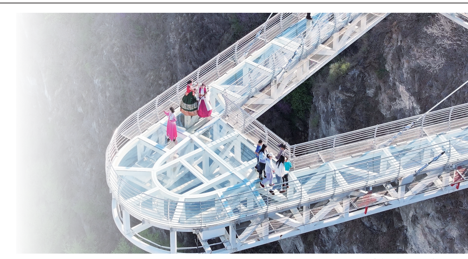
千年崖城风景区的玻璃廊桥。