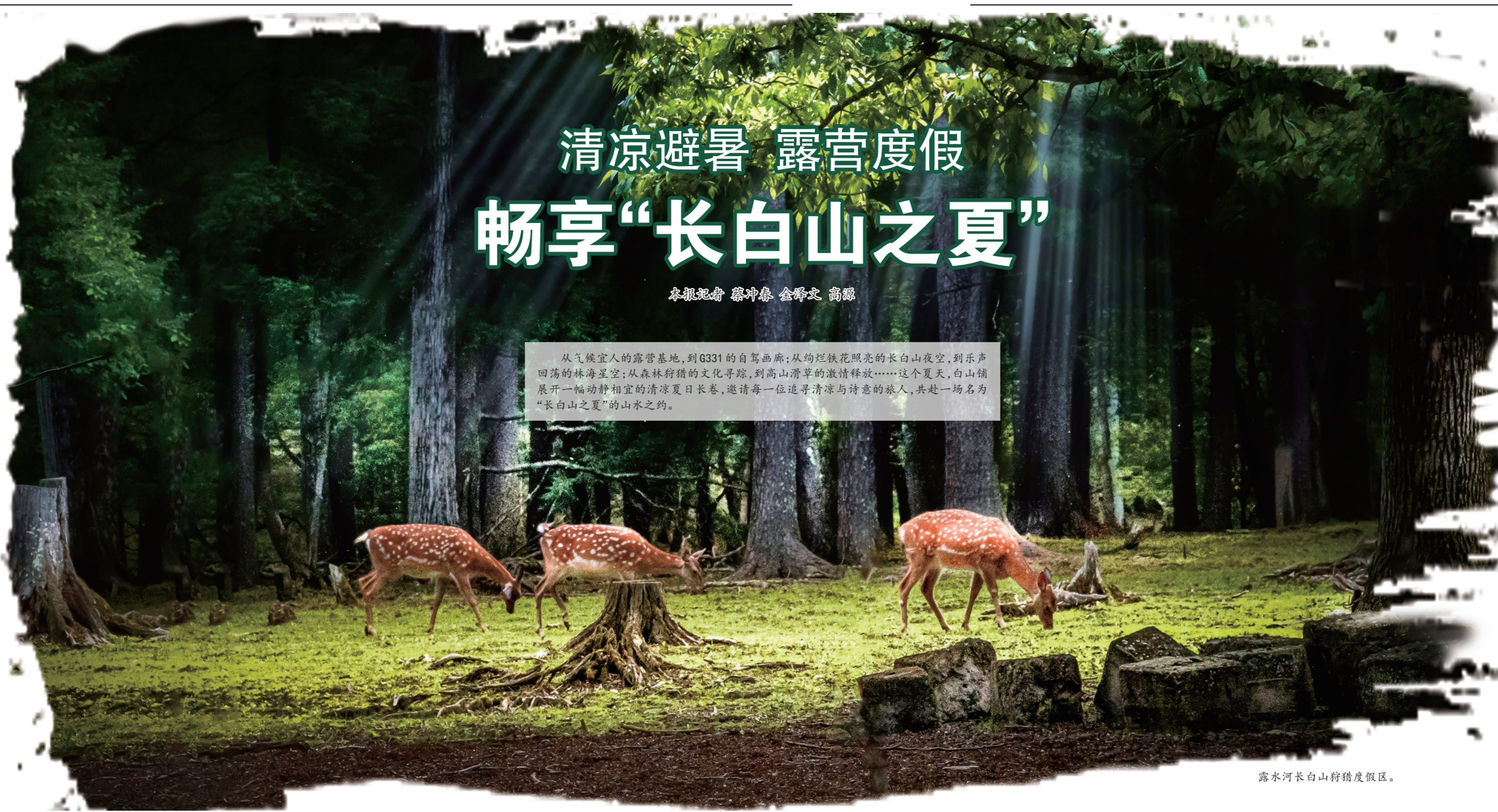
露水河长白山狩猎度假区。

从气候宜人的露营地,到G331的自驾游;从绚烂铁花照亮的长白山夜空,到乐声回荡的林海空;从森林狩猎的文化寻踪,到高山滑草的激情释放……这个夏天,白山铺展开一幅动静相宜的清凉夏日画卷,邀请每一位追求清凉与诗意的旅人,共赴一场名为“长白山之夏”的山水之约。