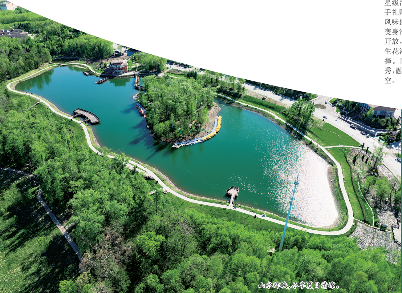
山歌峡畔,尽享夏日清凉。