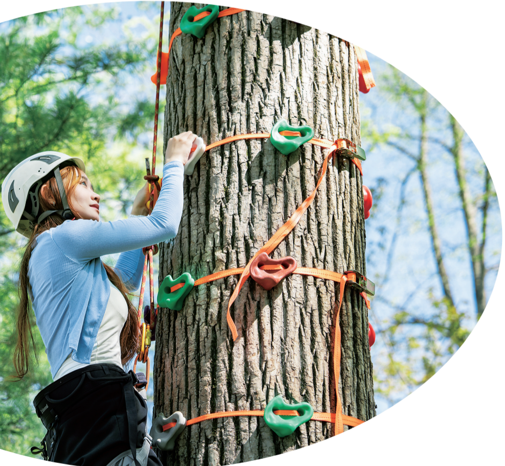
在长白山国际度假区体验攀树项目。