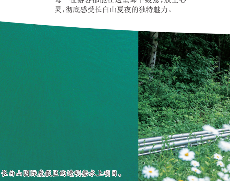
长白山国际度假区的惬意滑道。