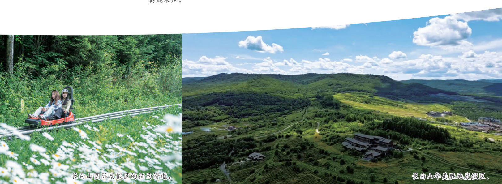
长白山华美胜地度假区。