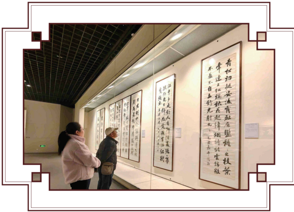
市民参观“雪满江山一塞翁——吉林三杰翹楚成多祿遺墨展”。