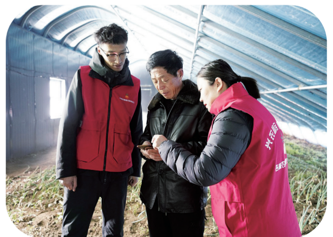
吉林农商银行辉南支行工作人员走访农户。

该支行推广“优先受理、优先审批、优先放款”一站式服务。设立春耕金融服务专柜和绿色通道,定制差异化授信方