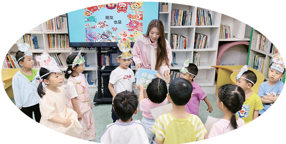
长春市图书馆开展亲子阅读活动(资料图片)

5月30日，长春市图书馆关工委联合吉林省籍少年儿童戏曲传承教育基地开展“童声唱国粹”京剧观赏体验活动。小读者们观看了由专业小戏骨带来的精彩表演，学唱《玉堂春》经典唱段，学习模仿刀、枪等舞台道具的用法，还特别走进后台，近距离观察戏服、道具及妆造过程，在台前幕后感受中华优秀传统文化的独特魅力。长春市图书馆绘阅讲师