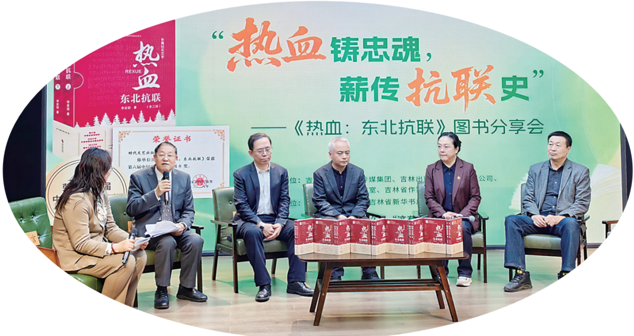
《热血：东北抗联》图书分享会在长春“这有书”文化空间举行

本报讯(记者纪洋 实习生刘璐瑶)为深入贯彻落实全民阅读工作要求，丰富少年儿童精神文化生活，5月27日至6月1日期间，长春市图书馆、长春市图书馆关工委立足少年儿童成长需求，策划开展了“阅见童年，书香同行”主题活动10余场，为小读者们送上了兼具书香、童趣与文化温度的“六一”国际儿童节礼物。