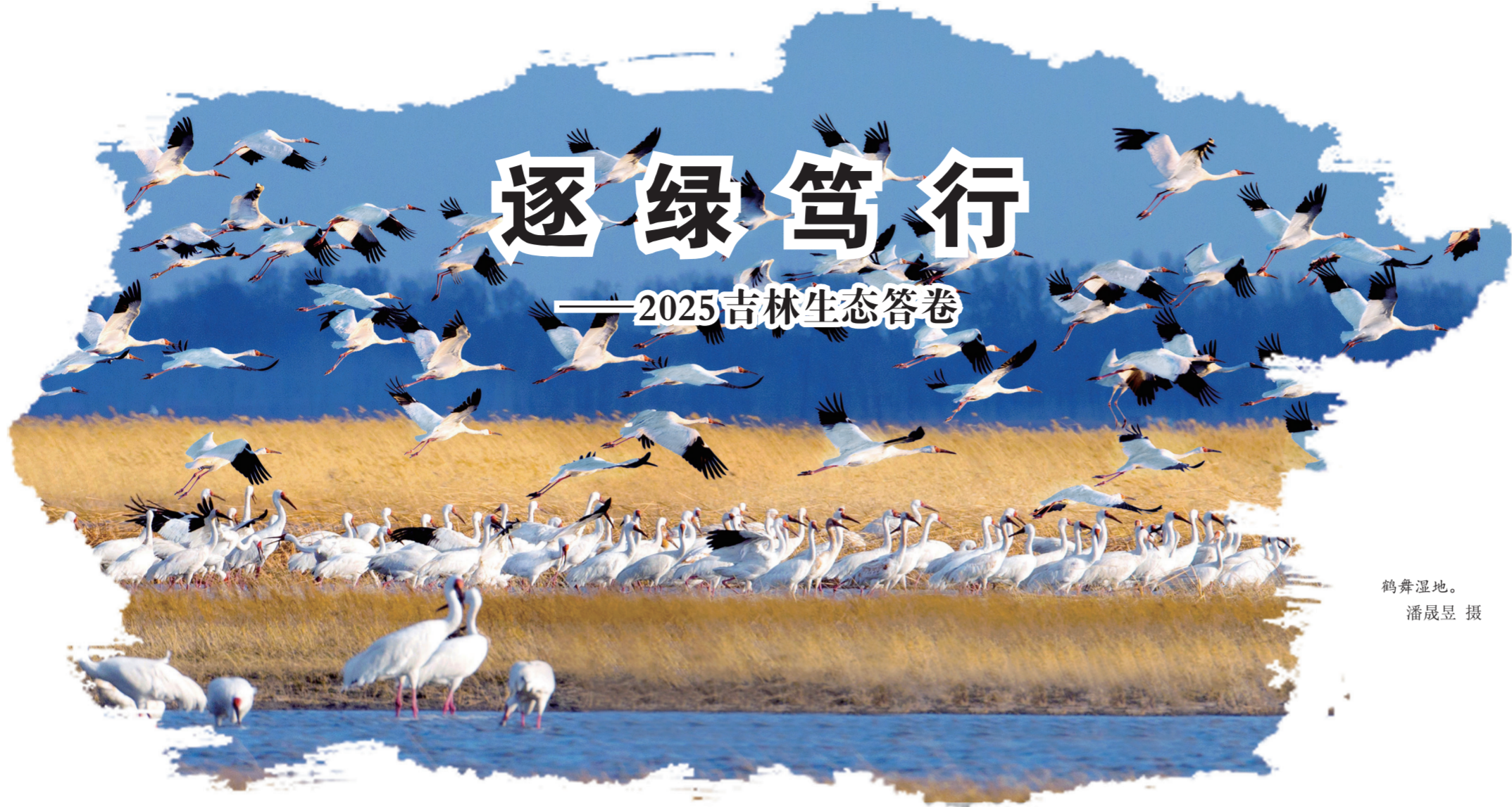
鹤舞湿地。

时序流转，步履铿锵。走过“十四五”收官之年，黑土地上的吉林大地，以一江碧水、满目晴空、葱郁生灵，铺展一纸厚重鲜活的生态答卷。