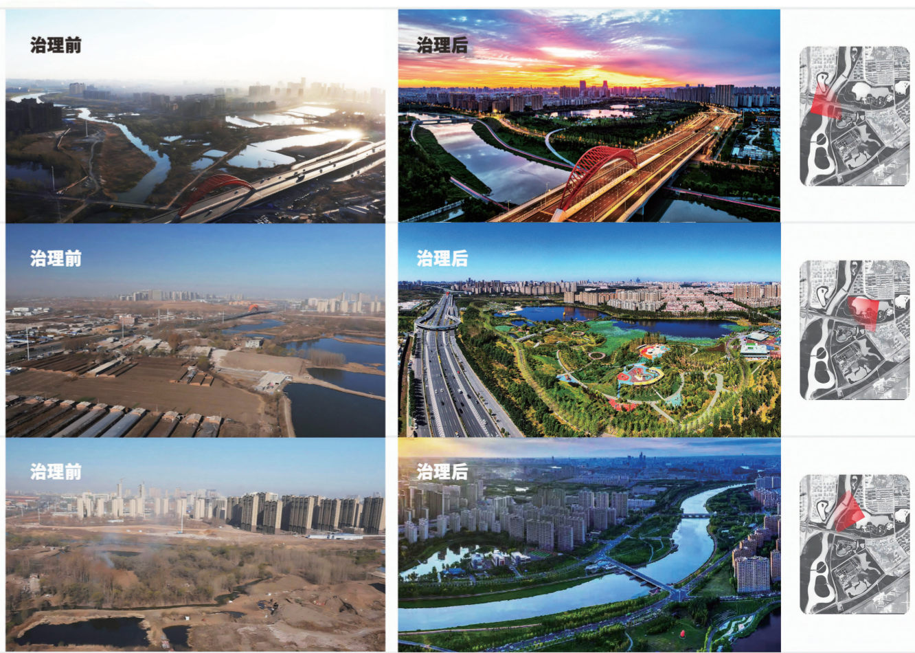
伊通河治理前后对比图。

未来，长春市将始终以习近平生态文明思想为根本遵循，持续巩固治理成效，深化“两山”转化实践，让伊通河成为生态惠民、生态利民、生态为民的治理典范。