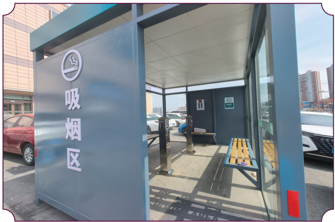
长春市欧亚卖场的室外吸烟室设有长椅和灭烟器。

在长春市欧亚卖场20号门和上海路万达广场1号门外，记者看到，这里均设有半封闭式室外吸烟室，外部标识醒目，内部设有座椅和灭烟器。对于这个新建的“玻璃房”，市民怎么看？记者进行了随机采访。